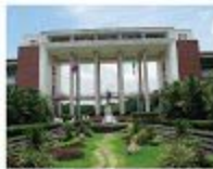
University of the Philippines