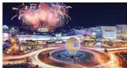
SM Mall of Asia