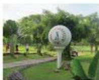
Veterans Golf Club

Tầng 4 Tòa nhà Clarelian Communication, số 8 đường Mayumi UP Village Diliman, Quezon City, Metro Manila