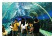
Manila Ocean Park

Chi phí sinh hoạt ở Philippines chỉ ngang bằng hoặc đắt hơn một chút so với Việt Nam. Bạn có thể đi shopping, du lịch, xem phim,... mà không cần đắn đo quá nhiều.