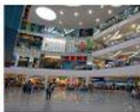
SM Shopping Mall