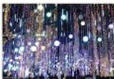
Ayala Triangle Gardens

Theo bảng xếp hạng của Viện khảo thí Giáo dục Mỹ dựa trên kết quả thi TOEFL năm 2010, Philippines xếp thứ 35 trên 163 quốc gia trên thế giới về trình độ tiếng Anh. Philippines là quốc gia thứ ba nói tiếng anh trên thế giới. Tiếng anh được sử dụng rất phổ biến từ bậc tiểu học cho đến các bậc sau đại học , ở nơi công cộng và trong các cơ quan hành chính, các bản tin, radio ,TV, báo trí, tạp trí.... Vì thế, bạn hoàn toàn có thể cải thiện trình độ tiếng anh của mình mọi nơi mọi lúc trong thời gian ở Philippines.