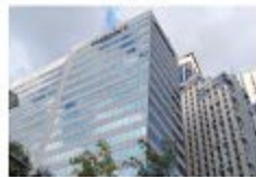
Accornew Eastwood City