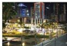
Bonifacio Global City High Street