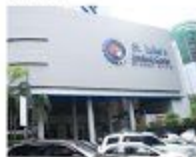
St. Luke's Medical Center